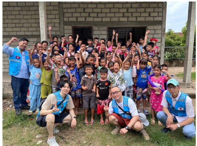
↑子ども達と絵本を届けてくださってる方たちです