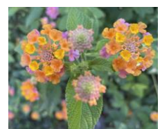
ラオスに咲いている花だそうです