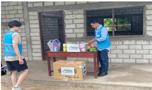
↑現地係の方たちです。