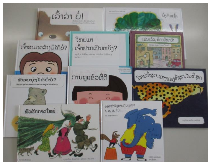
翻訳シールを貼った絵本