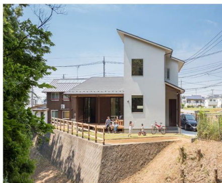
住まう人の暮らしを想う

小澤建築のコンセプトは、ご縁を頂いたお客様は、大切な友人であったり、家族であったり、過ごしていく時間や暮らしのカタチを思い描き富山の気候になじむ愛されるデザインで、安全、安心に暮らしていける住まいをご提案できるという思いで仕事をさせて頂いております。