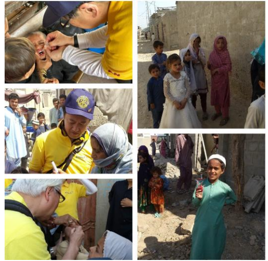
左 ロータリーの友9月号 右 昨年度のパキスタン(現地)でのポリオ活動の様子です。