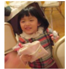
不思議な国の サンタクロース出現