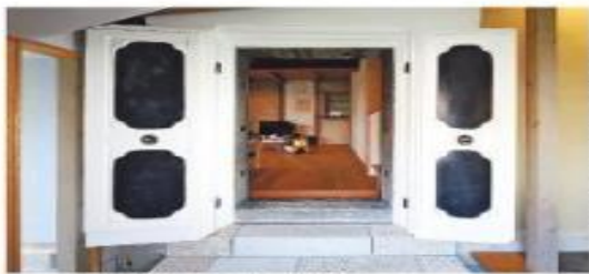
土蔵を改修した住宅「クラハウス」

わせて名前を付けています。親が子に名前を付ける感覚で「ハウス・マッターホルン」とか「カートンハウス」とかです。モニターに写真を映して説明してくれる。急勾配の屋根や箱を積み重ねたような建物の特徴が前面で表現されている。「愛される部分をつくるという感じですね。」 最近力を入れているのがリノベーション事業です。築110年の土蔵を改修した住宅の写真を見せてもらった。「クラハウス」と名付けた住蔵の扉をそのまま残したインテリアが斬新だ。市内の旧町部と呼ばれる地域は古い建物や空き家が多くあり「こうしたものをとんとん手がけていきたい」と言う。 最後に、理想の建築家の在り方を教えてくれた。オランダに留学した際に見たものが原点になっているという「ヨーロッパでは小さい村にも建築士がしっかりといて、住民がそこに頼るといふ関係性だった。地元の建築士に何でも相談に行けるような文化が根付いているといいですね」