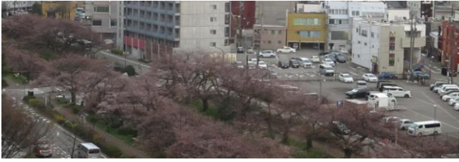
県民会館から松川ベリ