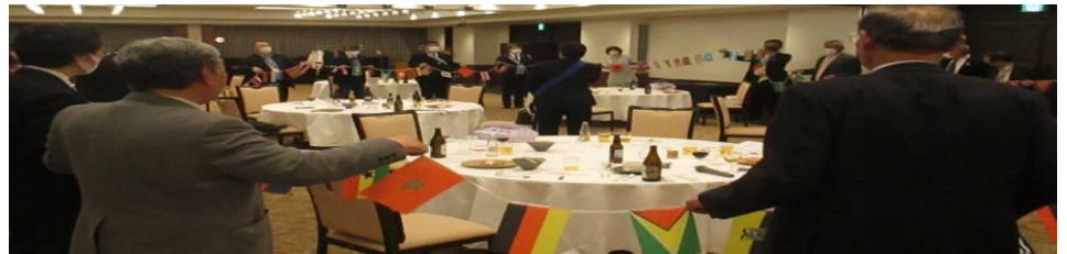
今回はご夫婦での参加でした。