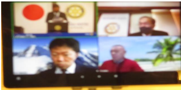
パソコン画面です。