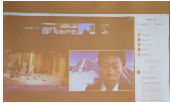
スクリーンに映した時です。